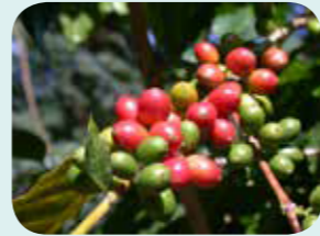
阿拉伯咖啡樹的果實