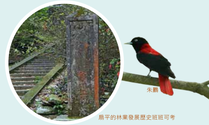
扇平的林業發展歷史班班可考

日據時期，金雞納樹因瘧疾研究被引進臺灣，共栽種3種：大葉金雞納、小葉金雞納、雜交金雞納，以供研究人員從樹皮中提煉奎寧製成治療瘧疾的藥物，今日的林業會館即為早期金雞納樹皮的曬皮場。如今，奎寧早已被合成的藥物所取代，但園區內仍可見到許多天然更新的樹苗。