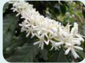
阿拉伯咖啡樹的花